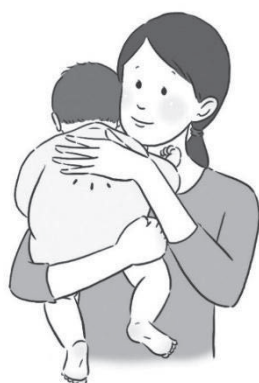
図9 げっぷの出し方